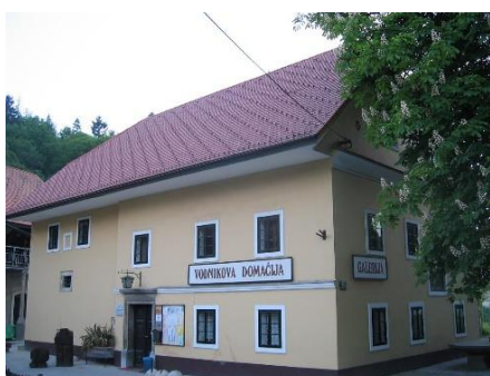
Vodnikovo domačijo upravlja KUD Vodnikova domačija.