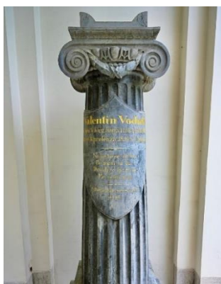
Na Vodnikovem nagrobniku na ljubljanskem Navju je napis v bohoričici.

(1) Jezikoslovec, pesnik, prevajalec, časnikar in duhovnik Valentin Vodnik, ki na naših tleh velja za »pervega« na številnih področjih, je za sabo pustil zelo bogato dediščino.