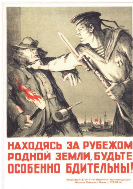
320. Бойм С. Находясь за рубежом родной земли, будьте особенно бдительны! 1945

Leta 1941, v začetnih dneh krvave domovinske vojne, je bil ustvarjen plakat „Ne govori!“ avtorjev N. Vatoline in I. Denisova, ki se je zaradi jedrnatosti podobe in slogana izkazal za vrhunski simbol budnosti. Leto 1941 je zaznamoval tudi nastanek slogana „Govoreči je zaklad za vohuna!“ Ta je naznanil začetek